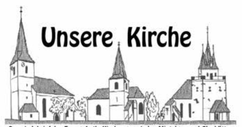
Gemeindebrief der Evang.-Luth. Kirchengemeinden Mistelgau und Glashütten